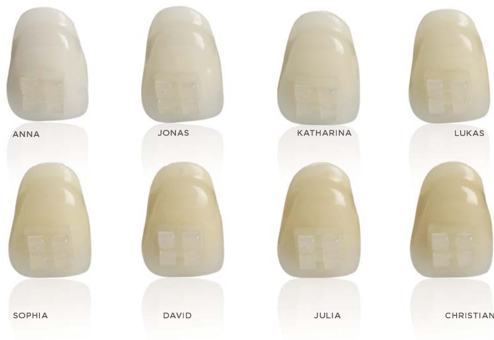
Fotos der InVu Brackets sind unbearbeitete Originalaufnahmen.